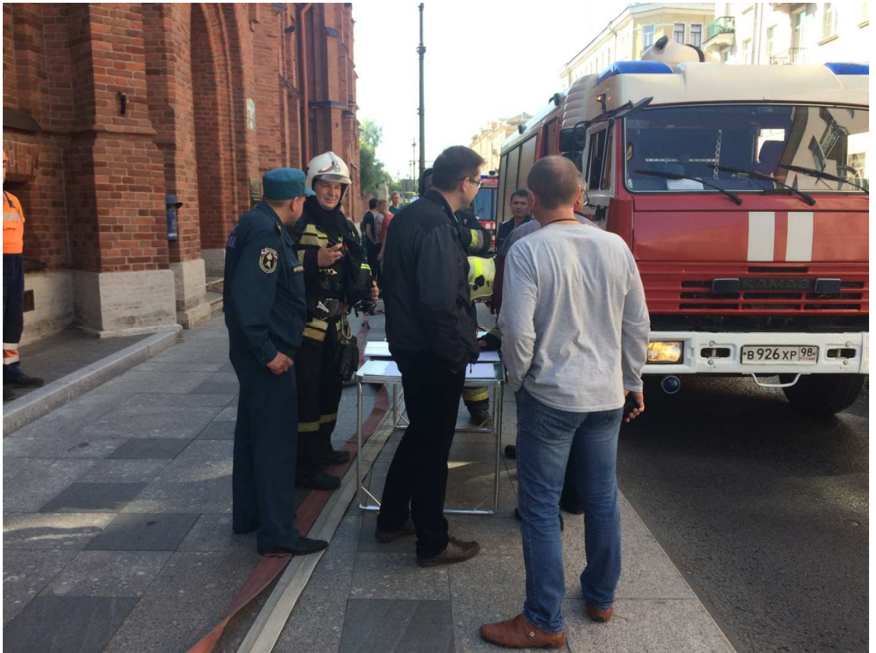
ОНДПР Центрального района 23.07.2019